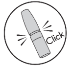
6. Settu hettuna á

Ef lausnin úðast ekki þegar þrýst er á hnappinn eða ef lyfið hefur ekki verið notað í meira en 7 daga skal undirbúa dæluna að nýju með því að þrýsta 2 sinnum á hnappinn.