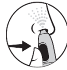
4. Þrýstu á hnappinn