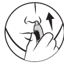
3. Settu stútinn inn í nösina