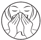
1. Snýttu þér